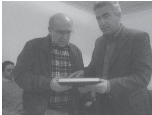
Ο Υπουργός Π.Ε.Χ.Ω.Δ.Ε κ. Γεώργιος Σουφλιάς με τον Δήμαρχο Τρικολώνων στην Αίθουσα του Δημοτικού Συμβουλίου, στη Στερνίτσα.

χος ενημέρωσε το παριστάμενο Υπουργό Π.Ε.Χ.Ω.Δ.Ε ότι ευελπιστεί για ενδεχόμενη παράλληλη ένταξη και χρηματοδότηση του έργου αποχετεύσεως της Στερνίτσας, όχι στο Πρόγραμμα των αποχετευτικών έργων της Περιφέρειας, αλλά και στο ειδικό πλαίσιο του Ευρωπαϊκού προγράμματος "ΠΕΡΙΒΑΛΛΟΝ" που διαχειρίζεται κεντρικά το ΥΠΕΧΩΔΕ.