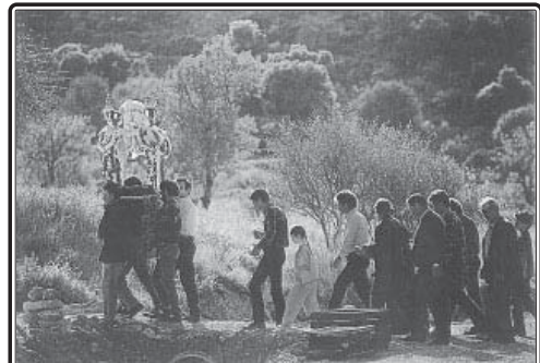
Η Ζωή εν τάφο κατετέθη Χριστέ...! και ύστερα η Ανάσταση! Η Άνοιξη! Γένοιτο στα πάθη μας! Στην ψυχή μας! Στα λάθη μας!

Γιά να βεβαιωθούν αν κάποιος είχε μάτι, Ερρίχναν σ' ένα ποτήρι με νερό, τρία αναμμένα κάρβουνα. "Αν τα κάρβουνα έφταναν στον πάτο, τότε είχε μάτι και με το νερό αυτό, τόν αναποδονίβανε με τήν ανάσπρωφη του χεριού.