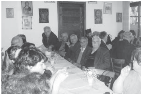
Το Μουλάτσι πάντα παρόν.

ντι της Μονής, απέδωσαν θαυμάσια τους βυζαντινούς ψαλμούς της ημέρας. Στο τέλος της Θείας Λειτουργίας δόθηκαν καφές, γλυκά και