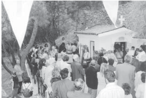
Το εκκλησάκι του Αγίου Κωνσταντίνου και Ελένης, γεμάτο από κόσμο κατά τον Εσπερινό, την παραμονή της εορτής.

Στις 21/5/2006, εορτή των Αγίων Κωνσταντίνου και Ελένης στο ομώνυμο εκκλησάκι που βρίσκεται στου Φιλοπάππου, μετόχι της Ιεράς Μονής Προδρόμου έγινε την παραμονή εσπερινός και ανήμερα Θεία Λειτουργία. Χοροστάτησαν ο Αρχιμανδρίτης πατήρ Λεόντιος της Ι. Μ. Προδρόμου και ο Αρχιμανδρί-