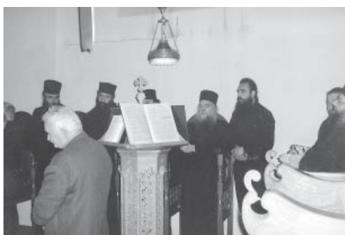
Το κατανυκτικό ψάλλισμο από τους μοναχούς της Ι.Μ. Προδρόμου.

Μονής, πατέρα Θεόκτιστου. Την εορτή τίμησαν με τη παρουσία τους ο Νομάρχης Αρκαδίας Δ. Κωνσταντόπουλος, ο Αντινομάρχης Κ. Για-