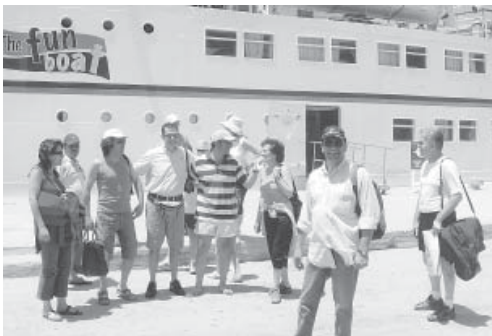
Αναμνηστική φωτογραφία έξω από το κρουαζιερόπλοιο.

Μετά την διαδικασία των εισιτηρίων επιβιβαστήκαμε στο πλοίο, γύρω στους 80 πατριώτες. Το προσωπικό του πλοίου, ευγενέστατο, μας τακτοποίησε σε μια από τις όμορφες αίθουσες του. Μετά