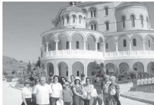
Προσκύνημα στον Άγιο Νεκτάριο.

δρόμης φτάσαμε στον Άγιο Νεκτάριο. Το πρώτο που αντικρίσαμε ήταν ο μεγαλοπρεπής Ναός του Αγίου, αφού προσκυνήσαμε ανεβήκαμε την ανηφόρα που σε οδηγεί στον τάφο και το Ιερό Σκήνωμά του. Οι προσκυνητές ήταν πάρα πολλοί, υπήρχε το αδιαχώρητο στον τάφο του. Πολλοί έβραζαν το αυτί τους πάνω για να ακούσουν τα βήματα του, άλλοι έλεγαν ότι τα άκουγαν και άλλοι όχι. Αφού προσκυνήσαμε και πήραμε την ευλογία του, πήραμε πάλι τον δρόμο για το πλοίο. Αφήνοντας πίσω την Αίγινα η επόμενη στάση ήταν ο Πόρος. Στη μέση της διαδρομής το προσωπικό του πλοίου μας είπε να πάμε στην τραπέζια για φαγητό. Πηγαίνοντας εκεί αντικρίσαμε ένα φιλόξενο και άνετο χώρο, αμέσως άρχισε το σερβίρισμα ενώ το φαγητό ήταν πλούσιο και καλό. Φτάνοντας στον Πόρο είδαμε ένα πλοίο νησί με μεγάλη κίνηση. Όλο το λιμάνι ήταν γεμάτο μαγαζιά, ταβέρνες, ουζάδικα, τουριστικά είδη και ό,τι άλλο φανταστεί κανείς. Μετά την περιήγησή μας στο λιμάνι, ε-