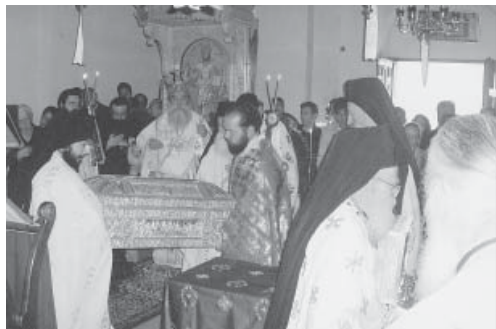
Τα ιερά λείψανα του Αγίου Αθανασίου Χριστιανουπόλεως.

κιερατική Θεία Λειτουργία, όπου χοροστάτησε ο Μητροπολίτης Σπάρτης Ευστάθιος - στη συνέχεια γευμάτισαν όλοι σε κοινή τράπεζα με την ευλογία του ηγουμένου της