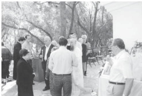
Ανήμερα στη θεία λειτουργία.

της πατήρ Συμεών. Κάθε χρόνο παρευρίσκονται επίσημα πρόσωπα, Σύλλογοι της Αρκαδίας και ιδιαίτερα δε της Γορτυνίας, πλήθος κόσμου μεταξύ των οποίων υπήρχαν και πάρα πολλοί Μουλατσαίοι.