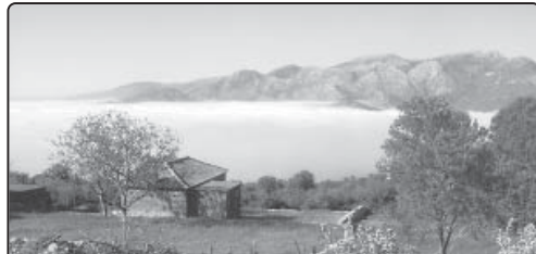
Ζητείται αγοραστής για το παραθαλάσσιο κτίσμα καθώς και για τη βραχονησίδα. Πληροφορίες: Βαγγέλης Θεοδωρόπουλος

Επίσης, η προσφώνηση Γέρος, δεν ήταν από τα γερμάματα, αλλά από το γεγονός ότι επισκέπτετο και λειτουργούσε με γερωνική σύνταξη και εμπειρία. Το προσωνύμιον Γέρος, Τον συνόδευε ακόμα και από την παιδική ηλικία.