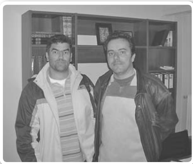
Ο παλιός είναι αλλιώς αλλά ο νέος...

δρομή των 10 ευρώ ήταν ένα επιπλέον κίνητρο για να ψηφίσουν περισσότεροι. Πολλοί πατριώτες προτίμησαν να έρθουν μετά το μεσημεριανό φαγητό. Η «άγρια ψήφων» ήταν μέσα στα καλώς εννοούμενα πλαίσια καθώς και η σταυροδοσία. Στις 6 το απόγευμα η κάλπη έκλεισε και η εφορευτική επιτροπή αποσύρθηκε σε ένα γραφείο μαζί με τρεις ακόμα πατριώτες καθώς η Παναρκαδική Ομοσπονδία είχε προγραμματίσει στη μεγάλη αίθουσα και άλλες εκλογές. Παρά τις διαμαρτυρίες μας προς την Παναρκαδική